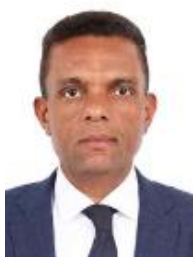
Otoni de Paula (MDB-RJ)