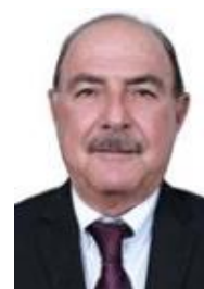
Dr. Zacharias Calil (União-GO)